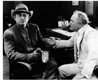
1920 HONEST HUTCH de Clarence G. Badger avec Nick Cogley