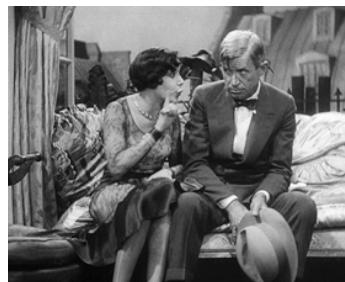
1929 ILS VOULAIENT VOIR PARIS (They had to see Paris) de Frank Borzage avec Fifi d'Orsay