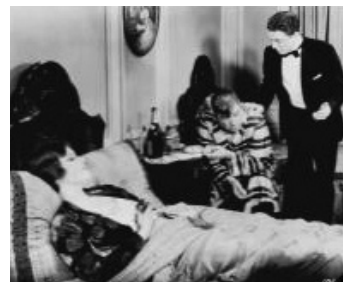
1930 SO THIS IS LONDON de John G. Blystone avec Maureen O'Sullivan