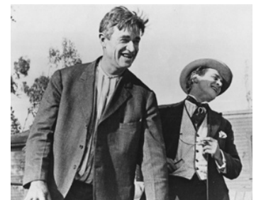
1923 UNCENSORED MOVIES, court métrage de Roy Clements