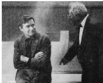
1921 UN HÉROS INVOLONTAIRE (An unwilling Hero) de Clarence G. Badger