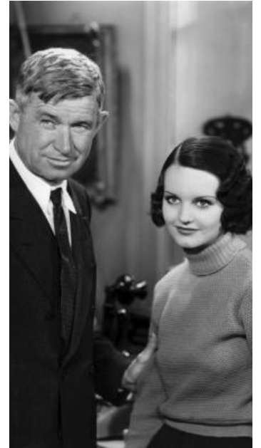
1933 DOCTEUR BULL (Doctor Bull) de John Ford avec Rochelle Hudson