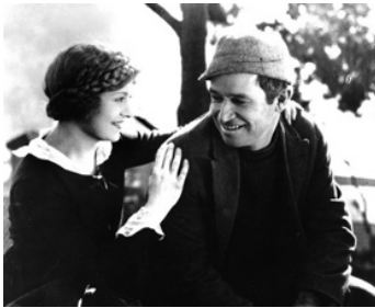
1920 JES' CALL ME JIM de Clarence G. Badger avec Irene Rich