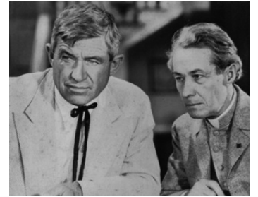
1934 LE JUGE PRIEST (Judge Priest) de John Ford avec Henry B. Walthall