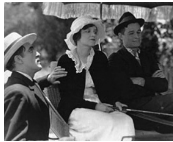
1919 ALMOST A HUSBAND de Clarence G. Badger avec Peggy Wood