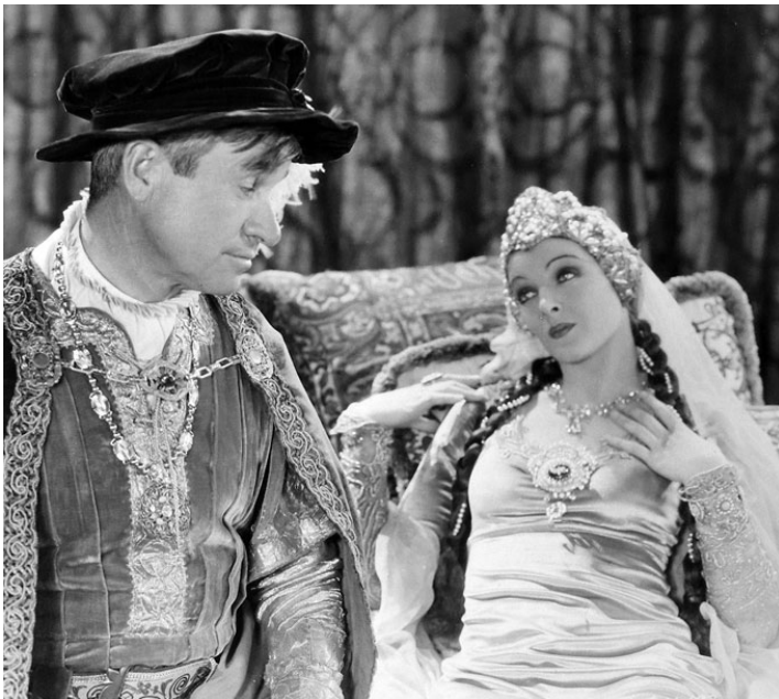
1931 A AMÉRICAIN À LA COUR DU ROI ARTHUR (A Connecticut Yankee at King Arthur's Court) de David Butler avec Myrna Loy