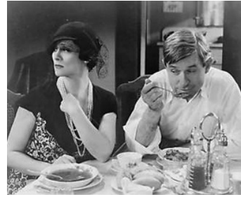
1931 LES AFFAIRES ET LE PLAISIR (Business and Pleasure) de D. Butler avec Jetta Goudal