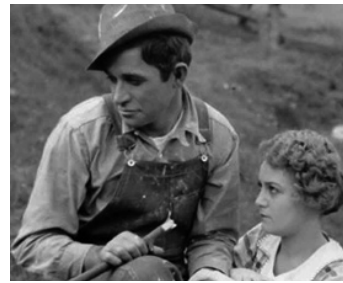
1919 JUBILO (Jubiloà de Clarence G. Badger avec Daily Quotes