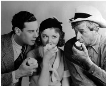
1933 LA FOIRE AUX ILLUSIONS (State Fair) de Henry King avec Lew Ayres, Janet Gaynor