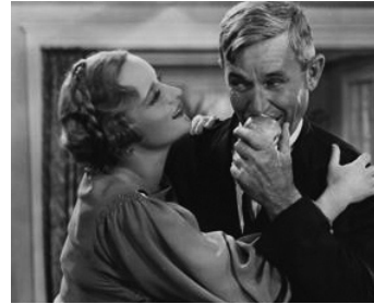
1934 HANDY ANDY (Handy Andy) de David Butler avec Mary Carlisle