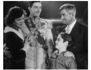
1931 BILL HARPER, AMBASSADEUR (Dollar Bill) de Sam Taylor avec Greta Nissen