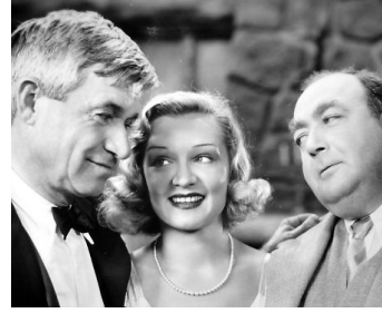
1932 MONSIEUR SKITCH (Mr Skitch) de James Cruze avec Florence Rice, W. Desmond