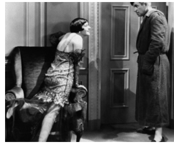
1931 AS YOUNG AS YOU FEEL de Frank Borzage avec Fifi d'Orsay