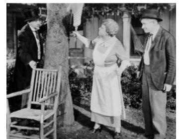
1934 LA VIE COMMENCE À 40 ANS (Life begins of forty) de George Marshall avec J. Darwell