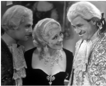
1932 LE VRAI BONHEUR (Down to Earth) de David Butler avec Dorothy Jordan