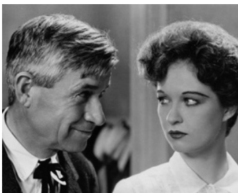
1934 LE DÉMON DE LA POLITIQUE (The County Chairman) de John G. Blystone avec Evelyn Venable