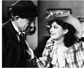
1932 DAVID HARUM (David Harum) de James Cruze avec Evelyn Venable