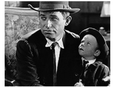
1920 THE STRANGE BOARDER de Clarence G. Badger avec Jimmy Rogers