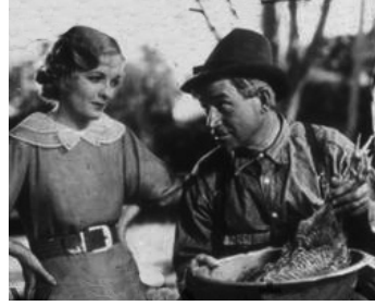
1932 JUBILO (Too busy to work) de John G. Blystone avec Marian Nixon