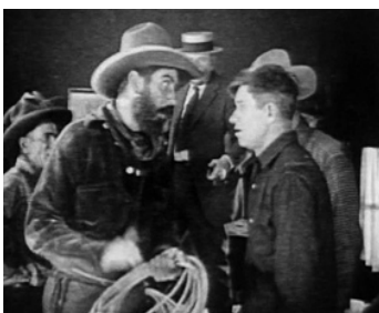
1922 THE ROPIN' FOOL de Clarence G. Badger