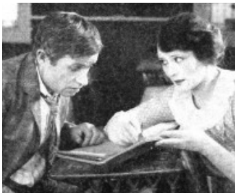
1921 BOYS WILL BE BOYS de Clarence G. Badger avec Irene Rich