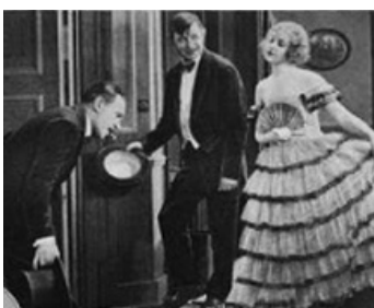
1927 SUR LA POINTE DES PIEDS (Tip Toes) de Herbert Wilcox avec Dorothy Gish