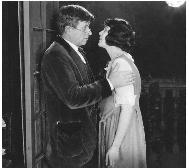
1921 JOUR DE GLOIRE (One Glorious Day) de James Cruze avec Lila Lee