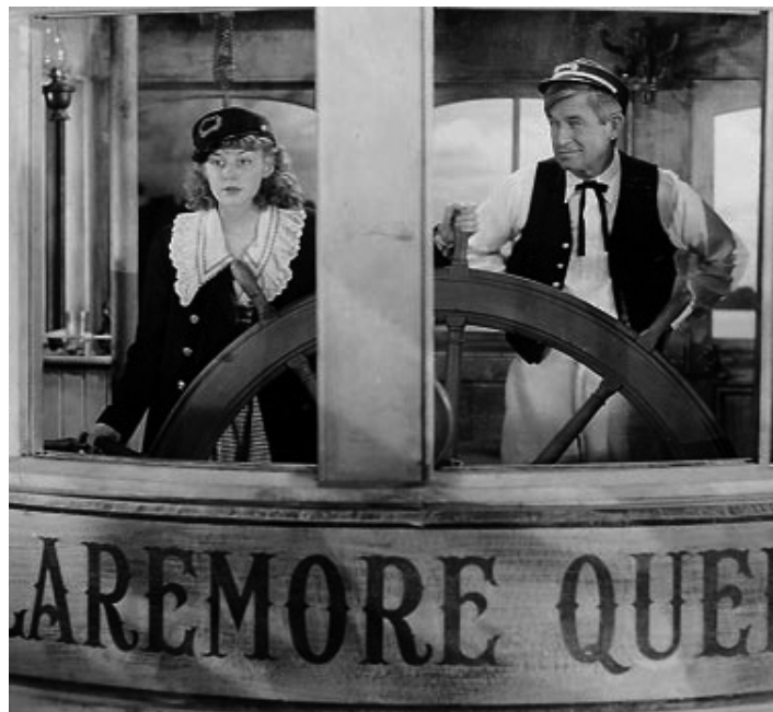
1935 STEAMBOAT BILL (Steamboat round the Bend) de John Ford avec Anne Shirley