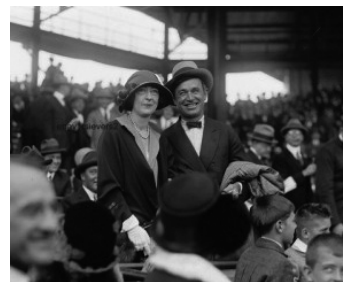
1923 HOLLYWOOD (Joligud) de James Cruze avec Hope Drown