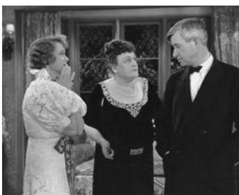
1935 DOUBLING THOMAS de David Butler avec Billie Burke, Alison Skipworth